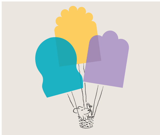
Disegno: Marija Medved

Possiamo immaginare la vita senza musica, letteratura, film, danza o teatro? La mostra presenterà il Bazar culturale come luogo di incontro nazionale dedicato all'educazione culturale e artistica, dove si intrecciano tutti gli ambiti della cultura e dell'arte. Siete invitati a sbirciare attraverso le finestre spalancate e far entrare l'aria, piena di nuove idee!