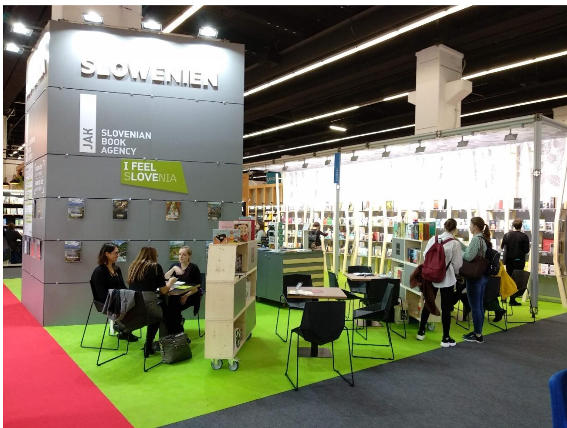
Fotografija: Slovenska nacionalna stojnica s šestimi založniškimi postajami na knjižnem sejmu v Frankfurtu oktobra 2019